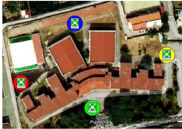
Vista d'insieme con i luoghi di raccolta

L'edificio è dotato di riserva idrica antincendio ; il generatore termico ( di recente installazione ) è posto all'interno dell'edificio .